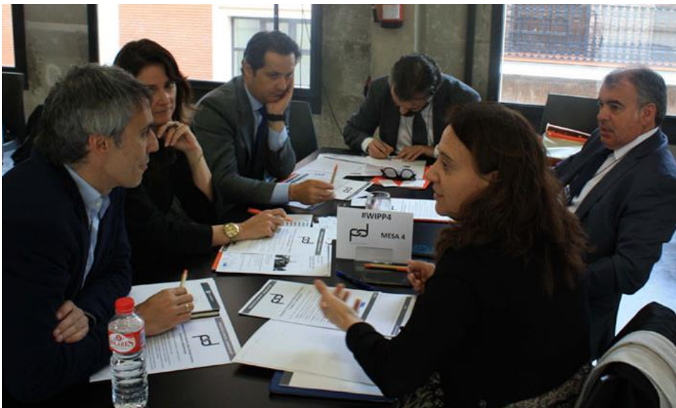
Figura 12. Mesa Redonda 4

Algunas de las conclusiones acordadas fueron: la diferenciación entre colaboración donde lo público y privado son socios, mientras que en la participación lo privado se supedita a lo público; o que los modelos de participación y colaboración son necesarios en todas las coyunturas y situaciones.