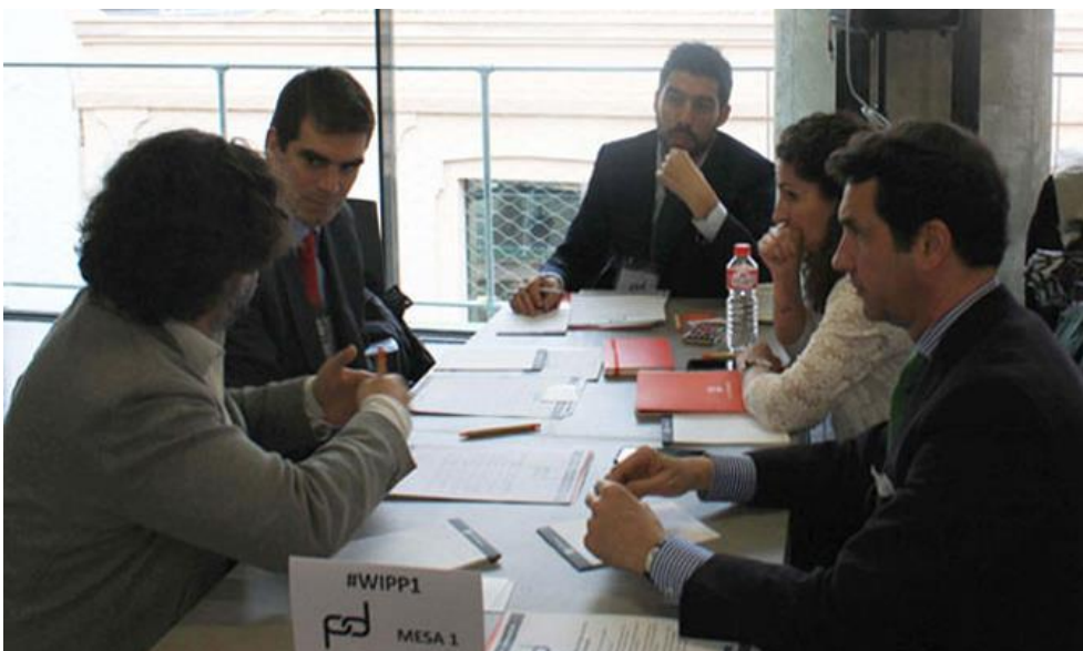
Figura 6. Mesa Redonda 1

Algunas conclusiones a las que se llegaron en esta mesa fueron: la Participación no engloba todas las posibilidades de relación entre los dos actores; la Ley de Contratos es una iniciativa que necesita mayor claridad; la Participación Público Privada es necesaria en todos los escenarios económicos; el interés actual por las PPP no tiene una relación causa-efecto con la crisis, sino con una madurez social; o la necesidad de un marco regulador y de gestiones ágiles.