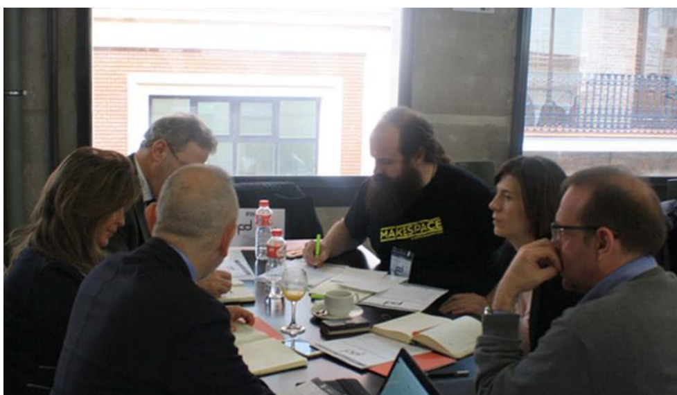
Figura 16. Mesa Redonda 6

En la Mesa 6, como conclusiones, caben destacar: la cooperación entre Administración Pública y empresas para resolver problemas prioritarios comunes; la PPP debe producirse siempre, no únicamente en las crisis económicas; o la falta de transparencia para transmitir los casos de éxito.