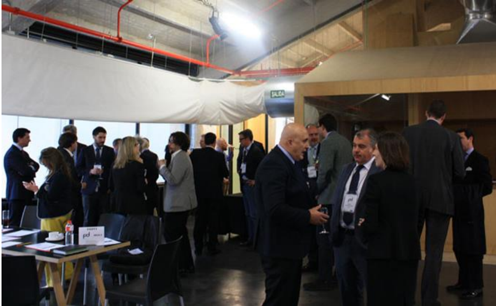
Figura 4. Pausa Café / Networking

Tras el bloque inicial de introducción y mesa redonda, se realizó una pausa para el café-networking y se conformaron los grupos de trabajo.