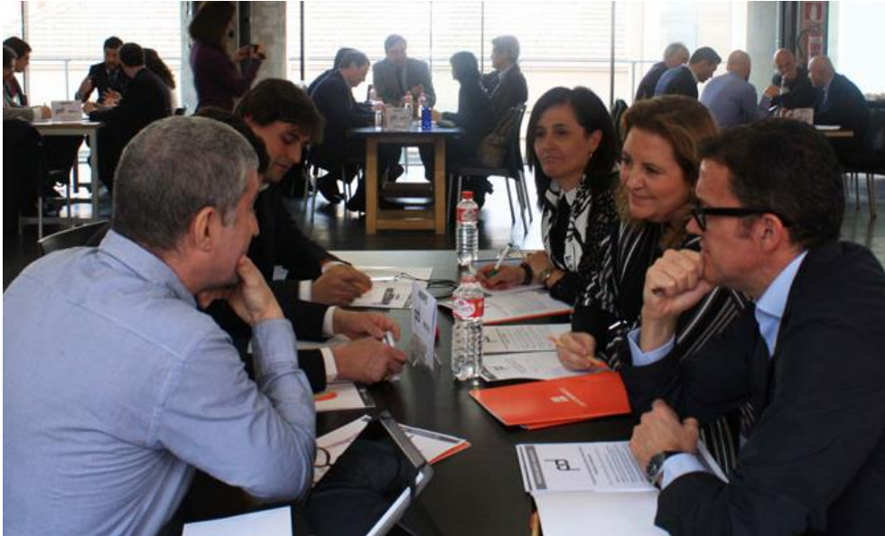
Figura 13. Mesa Redonda 5

La Mesa 5 estuvo integrada por RECI, Aquila Capital Investment GmbH, Real Estate Analyst, REDES Coop, Ciudadanos y Bankia.