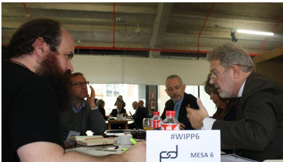
Figura 15. Mesa Redonda 6

Compusieron la Mesa 6 representantes de Make-Space, Bonopark, REDES Coop, AXA Real Assets, PHILIPS y CGR Arquitectos.