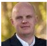
Stefan Junstrand @sjunstrand 20 abr.

En marcha Workshop Innovación Participación Público Privado #WIPP @lealines @grupotecmared @MADRID @medialabprado