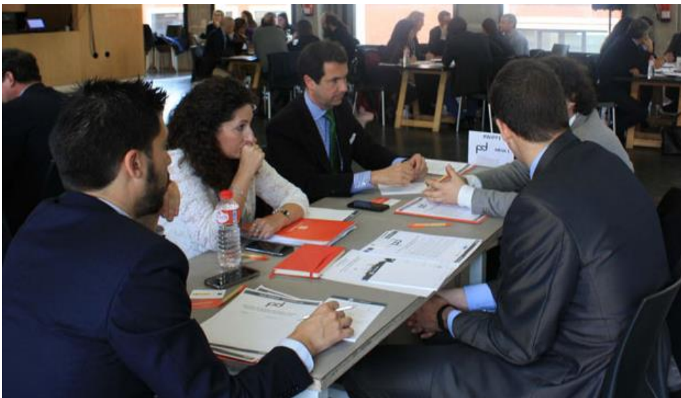
Figura 5. Mesa Redonda 1

La Mesa 1 ha estado compuesta por representantes de Nexo Arquitectura, Lechuga Abogados, SEGITTUR, Fundación Inidea - Ayuntamiento Valencia y Banco Santander España.