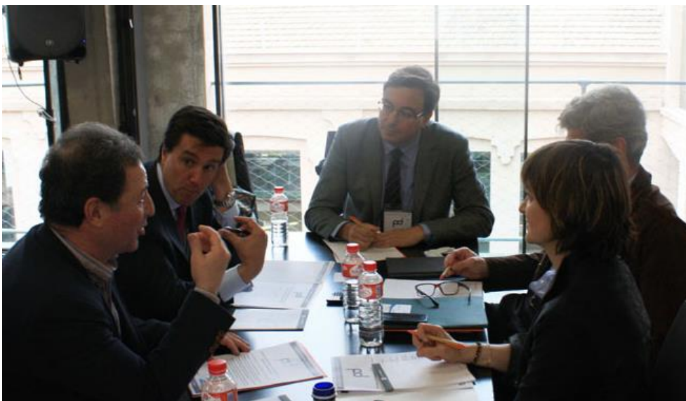
Figura 8. Mesa Redonda 2

Como conclusiones de la Mesa 2 caben destacar: la necesidad de fórmulas de relación entre entidades públicas y privadas para un mejor servicio a la sociedad; la PPP debe desarrollarse en cualquier coyuntura económica, siendo los momentos de crisis en los que se profundice en una mayor eficiencia e innovación en la prestación de Servicio Público.