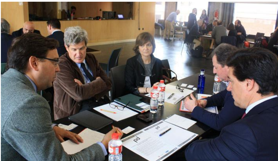
Figura 7. Mesa Redonda 2

En la Mesa 2 se reunieron expertos de Urbex Arquitectura, Ayuntamiento de Madrid, Garrigues, MERLIN Properties y Mercamadrid.