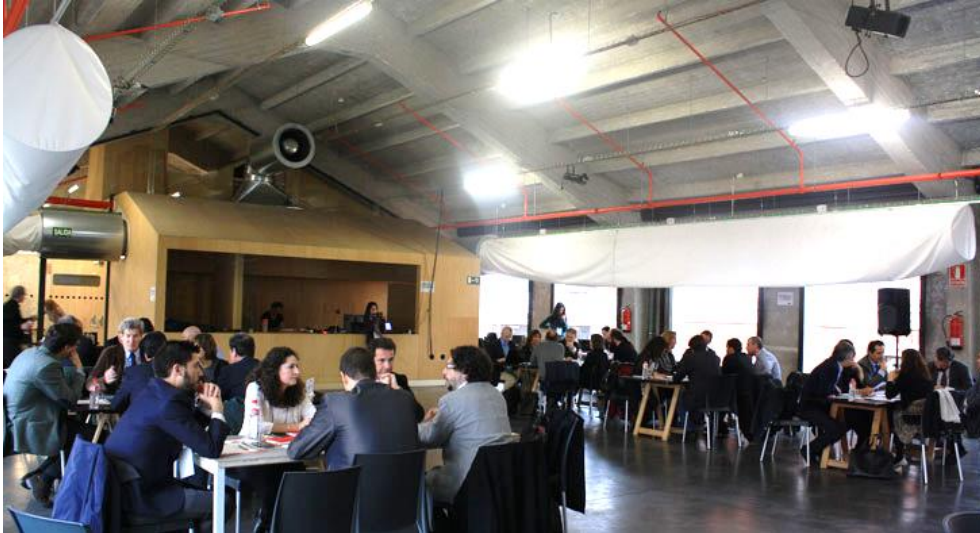
Figura 17. Trabajo en Mesas

Una vez terminadas las dos horas de desarrollo de las Mesas de Trabajo, el evento concluyó con un cóctel en el que los asistentes aprovecharon para hacer networking y seguir intercambiando puntos de vista sobre la Participación Público Privada.