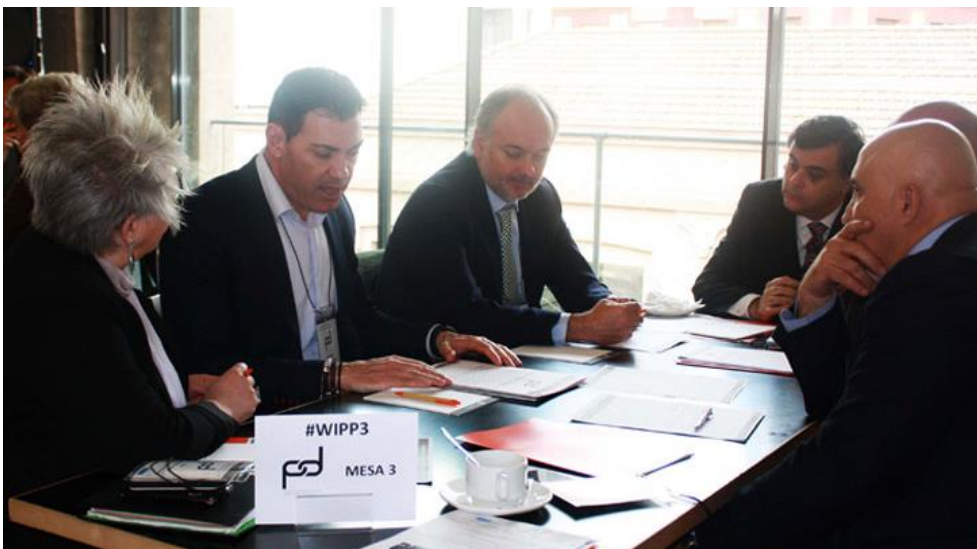
Figura 10. Mesa Redonda 3

Algunas de las conclusiones a las que llegaron en la Mesa 3 fueron: la definición de la PPP como proceso en el que participan el sector público y el sector privado con un objetivo común, la mejora del servicio al ciudadano y con un beneficio para los dos.