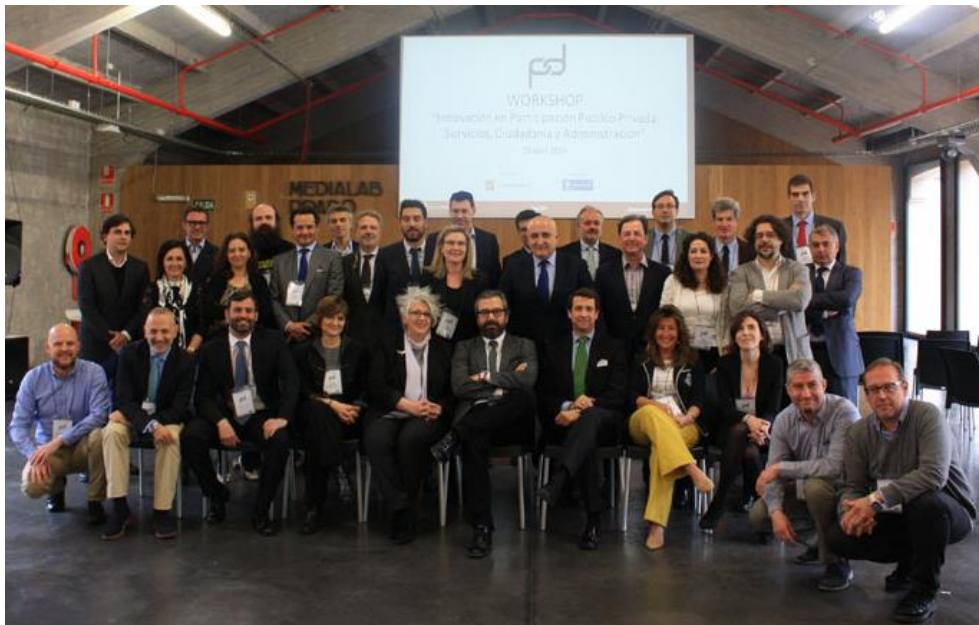
Figura 1. Participantes Workshop

Este Workshop, forma parte de una serie de eventos de trabajo con profesionales que el Grupo Tecma Red organiza sobre temas clave y nuevas tendencias de cara a obtener conclusiones que contribuyan a generar líneas a seguir para su fomento y desarrollo, dentro de los sectores implicados.