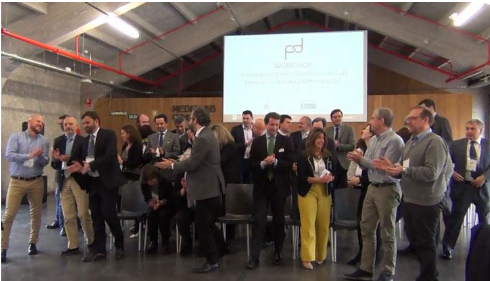
Figura 18. Foto Final Workshop

Una vez terminadas las dos horas de desarrollo de las Mesas de Trabajo, el evento concluyó con un cóctel en el que los asistentes aprovecharon para hacer networking y seguir intercambiando puntos de vista sobre la Participación Público Privada.