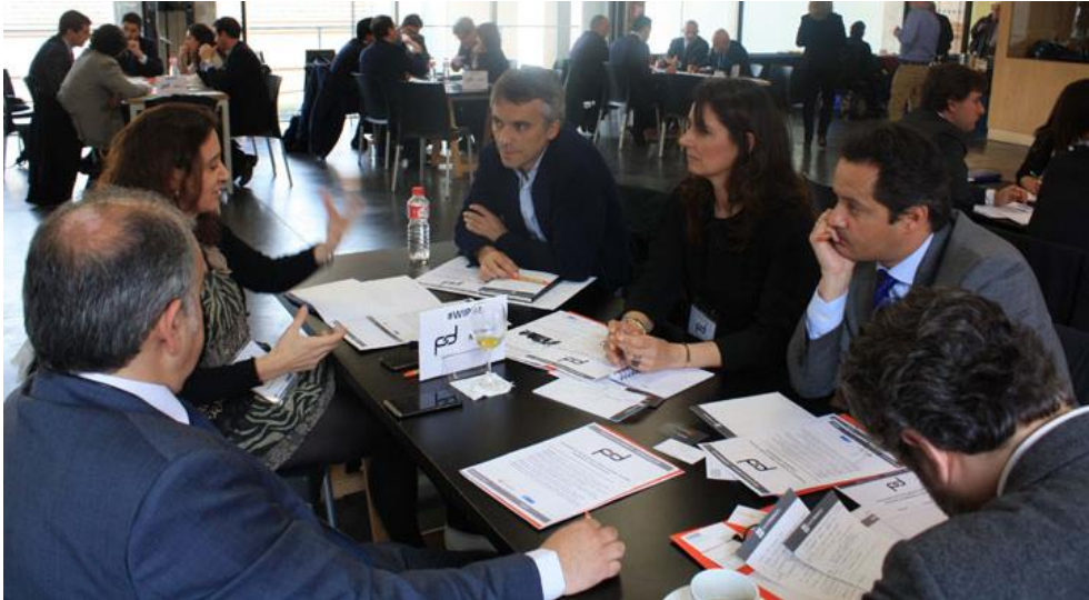
Figura 11. Mesa Redonda 4

La Mesa 4 estuvo compuesta por Representantes de COAM, GISTC, Broseta Abogados, IBM, Mercado de Motores, AXA Real Estate y Foster + Partners.