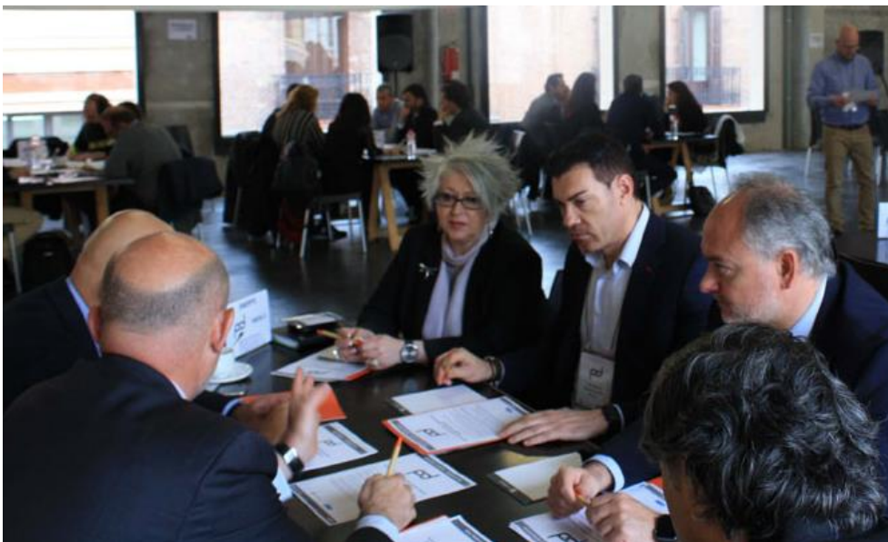
Figura 9. Mesa Redonda 3

La Mesa 3 ha contado con la participación del Ayuntamiento de Madrid, Ingesport, Vodafone, Monthisa, Blusens y Fundación ONCE.