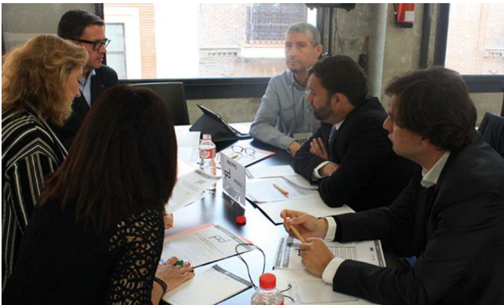
Figura 14. Mesa Redonda 5

Los representantes de la Mesa 5 llegaron a las siguientes conclusiones: la Participación tiene que gestionar lo común; generar modelos más estables que no dependan de la coyuntura económica y la existencia de desconfianza mutua que hay que superar.